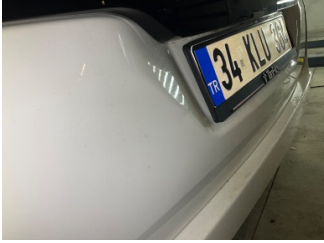
Bagaj kapağı/kapısı, Bagaj kapısı > Vuruk