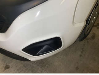
Tampon, ön, Ön tampon > Küçük Çizik