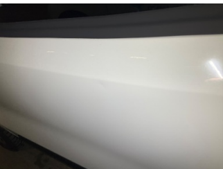
Kapı, sol ön, Kapı, sol ön > Vuruk