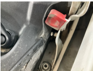
Motor kaputu, Kilit mekanizması > Ezik