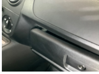
Pano/Göstergeler, Torpido gözü > Sabitlemesi Hatalı