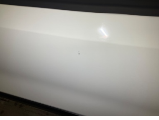
Kapı, sol ön, Kapı, sol ön > Taş izi