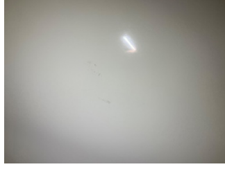
Kapı, sol arka, Kapı, sol arka > Küçük Çizik