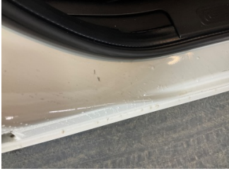
Kaporta, B-direk, sağ > Çizik