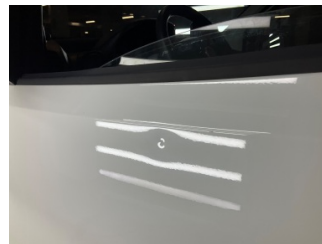
Kapı, sol ön, Kapı, sol > Noktasal Ezik