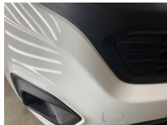
Tampon, ön, Ön tampon > Rötüş