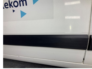
Kapı, sol ön, Kapı bandı > Çizik