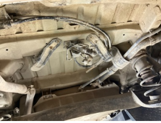
Dokümantasyon ve Ekipmanlar, İstapne > Sökülmüş-Yok