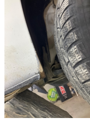
Çamurluk, sağ, Çamurluk, sağ > Boyası Atmış