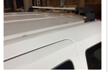
Kaporta, Sol Üst Frangart > Ezik