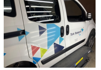
Kapı, sağ arka, Kapı, sağ arka > Etiket Yapıştırılmış