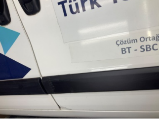
Kapı, sağ ön, Kapı bandı > Çizik