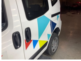
Çamurluk, sol arka, Çamurluk, sol arka > Etiket Yapıştırılmış