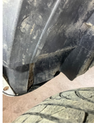
Çamurluk, sağ arka, Davlumbaz > Kırılmış