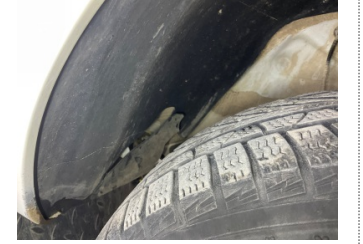
Çamurluk, sağ, Davlumbaz > Hasarlı