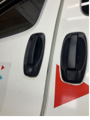
Kapı, sol ön, Kapı, sol ön > Boyası Atmış

Sayfa: 11/13 Araç Çıkış Tarihi: 13.05.2026 09:35