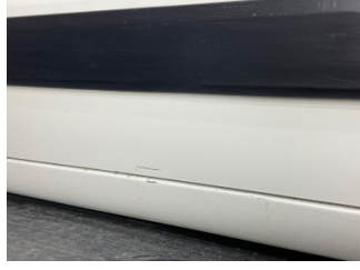
Kapı, sol ön, Kapı, sol ön > Boyası Atmış