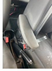
Döşemeler/Kapaklar, Kol dayaması, ön > Hasarlı