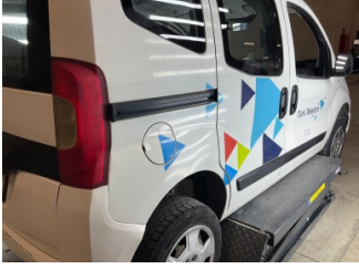
Çamurluk, sağ arka, Çamurluk, sağ arka > Etiket Yapıştırılmış