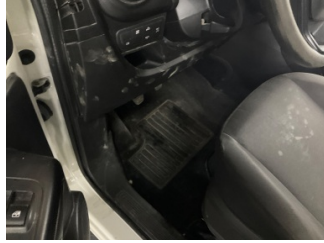
Taban, Paspaslar > Eksik