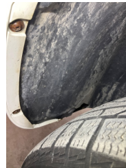
Çamurluk, sol, Davlumbaz > Hasarlı