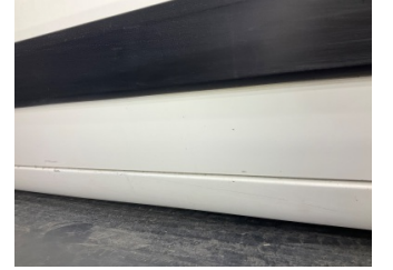
Marşbiyel, sol, Marşbiyel, sol > Çizik