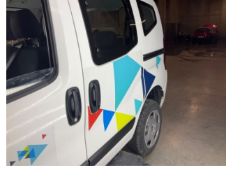
Kapı, sol arka, Kapı, sol arka > Etiket Yapıştırılmış