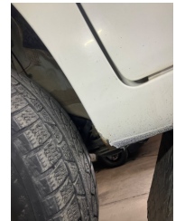
Çamurluk, sol, Çamurluk, sol > Boyası Atmış