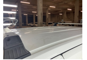
Tavan, Tavan > Hasarlı