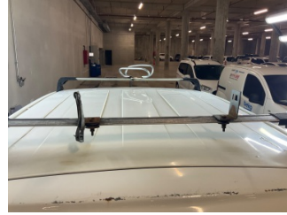
Tavan, Tavan > Hasarlı