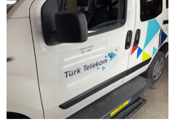
Kapı, sol ön, Kapı, sol ön > Etiket Yapıştırılmış