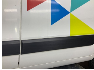
Kapı, sol arka, Kapı bandı > Çizik