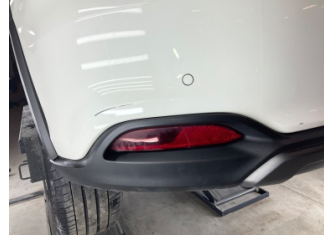
Tampon, arka, Arka tampon > Küçük Çizik