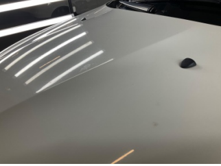
Motor kaputu, Motor kaputu > Yakıcı Madde Ile Zarar Görmüş