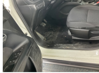
Taban, Paspaslar > Sökülmüş- Yok