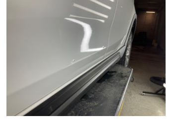
Kapı, sol ön, Kapı, sol ön > Noktasal Ezik