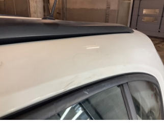
Kaporta, Sol Üst Frangart > Standart Dışı Onarım

Sayfa: 10/11 Araç Çıkış Tarihi: 18.04.2026 13:35