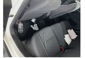
Taban, Paspaslar > Sökülmüş- Yok