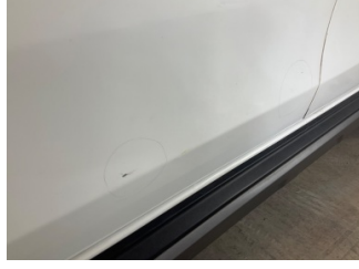
Kapı, sol ön, Kapı, sol ön > Standart Dışı Onarım