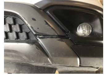
Tampon, ön, Ön tampon ızgarası > Hasarlı