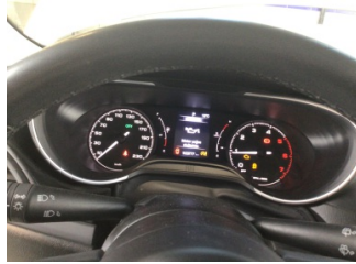
Motor, Bakım > Uyarı Lambası Yanıyor