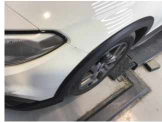
Çamurluk, sol, Çamurluk ağızı > Hasarlı