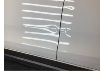
Kapı, sol ön, Kapı, sol ön > Ezik