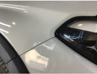
Çamurluk, sağ, Çamurluk, sağ > Standart Dışı Onarım