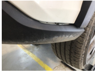
Tampon, arka, Arka tampon > Ayarsız