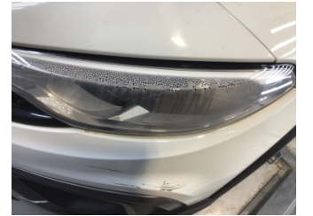
Farlar, Far, sol > Deforme Olmuş