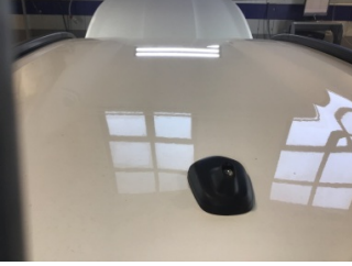
Komünikasyon/Navigasyon/EğlenceKoltuklar, arka, Arka koltuk > sistemleri, Anten > Sökülmüş-Yok Kirlenmiş