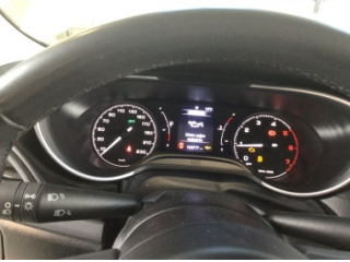
Motor, Motor > Uyarı Lambası Yanıyor