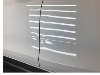
Kapı, sol arka, Kapı, sol arka > Ezik