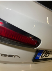
Arka lambalar, Arka lamba camı, sol > Hasarlı