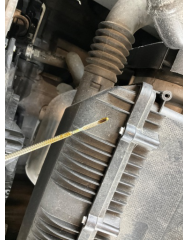
Motor, Yağ seviyesi > Eksik