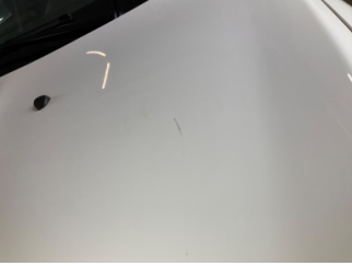
Motor kaputu, Motor kaputu > Küçük Çizik