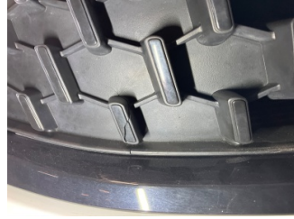
İlave parçalar, ön, Ön panjur > Hasarlı