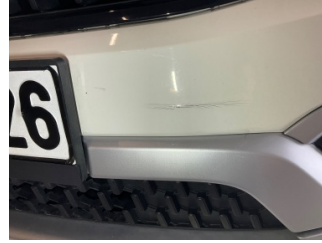
Tampon, ön, Ön tampon > Çatlak