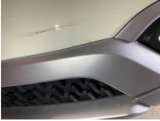
Tampon, ön, Spoiler > Kırılmış