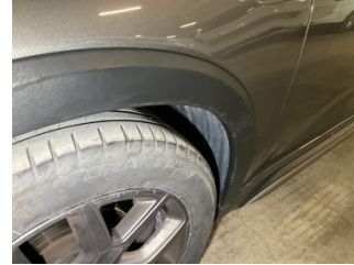
Çamurluk, sol, Nikelaj, ızgara > Çizik