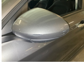
Dikiz aynası, sol, Dış dikiz aynası kapağı > Çizik