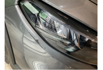
Farlar, Far camı, sağ > Çizik