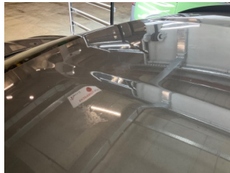
Tavan, Tavan > Yakıcı Madde ile Zarar Görmüş