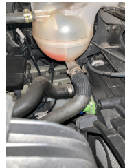
Motorsoğutması, Soğutma sıvısı > Eksik