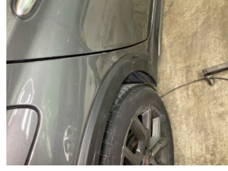
Çamurluk, sağ arka, Nikelaj > Ezik