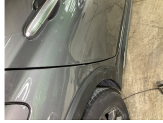
Kapı, sağ arka, Kapı, sağ arka > Hasarlı