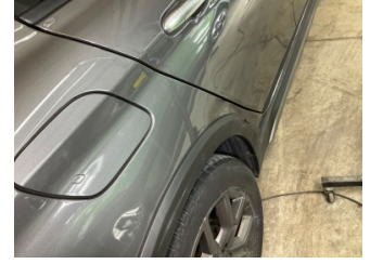
Çamurluk, sağ arka, Çamurluk, sağ arka > Hasarlı