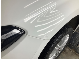
Çamurluk, sol, Çamurluk, sol > Noktasal Ezik