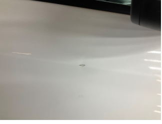
Kapı, sağ ön, Kapı, sağ > Ezik