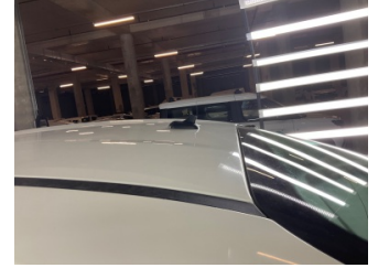
Komünikasyon/Navigasyon/Eğlence sistemleri, Anten > Sökülmüş-Yok