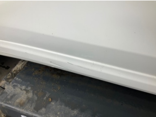
Marşbiyel, sol, Marşbiyel, sol > Çizik