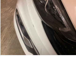
Tampon, ön, Ön tampon > Küçük Çizik

Sayfa: 11/12 Araç Çıkış Tarihi: 16.06.2026 10:45