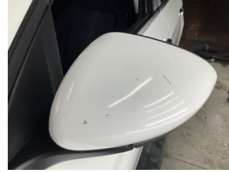
Dikiz aynası, sol, Dış dikiz aynası kapağı > Çizik