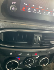
Kalorifer/Klima, Havalandırma izgarası sabitlemesi > Hasarlı

Sayfa: 10/11 Araç Çıkış Tarihi: 16.06.2026 11:59