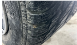
Jant, sol ön > Hasarlı