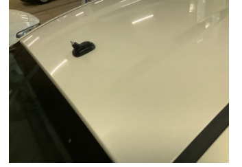
Komünikasyon/Navigasyon/Eğlence sistemleri, Anten > Sökülmüş-Yok