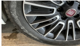
Jant kapağı seti > Kırılmış