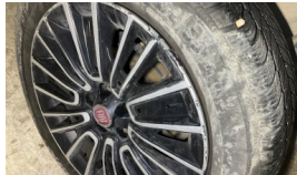
Jant kapağı seti > Kırılmış