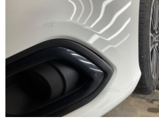
Sis lambaları, Sis Izgarası Sol > Sabitlemesi Hatalı