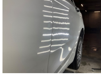
Kapı, sol arka, Kapı, sol arka > Standart Dışı Onarım