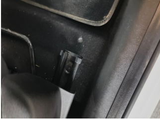
Taban, Taban halısı > Yakıcı Madde ile Zarar Görmüş