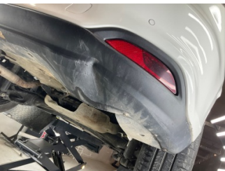
Tampon, arka, Spoiler > Ezik