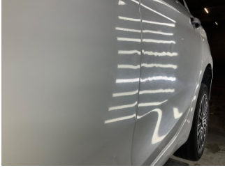
Kapı, sol ön, Kapı, sol ön > Küçük Vuruk