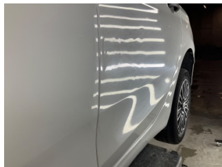
Kapı, sol arka, Kapı, sol arka > Ezik