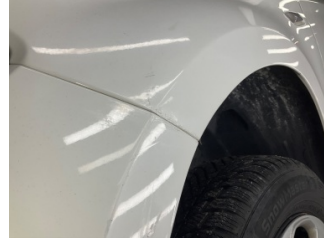
Çamurluk, sol, Çamurluk, sol > Standart Dışı Onarım