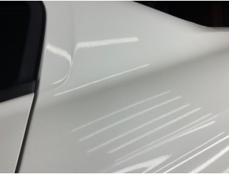
Kaporta, Kaporta > Deforme Olmuş