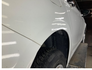
Çamurluk, sağ arka, Çamurluk, sağ arka > Standart Dışı Onarım