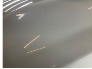
Kaporta, Kaporta > Deforme Olmuş