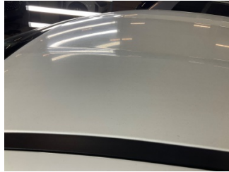
Kaporta, Kaporta > Deforme Olmuş