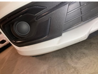
Tampon, ön, Ön tampon > Ezik