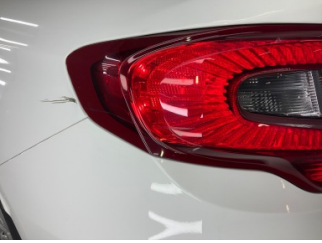
Arka lambalar, Arka lamba camı, sol > Çizik