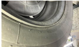
Tekerlek seti > Çatlak