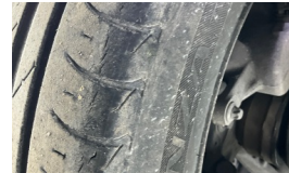
Tekerlek seti > Çatlak