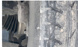
Tekerlek seti > Çatlak