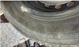
Tekerlek seti > Çatlak