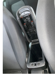
Döşemeler/Kapaklar, Kol dayaması, ön > Hasarlı