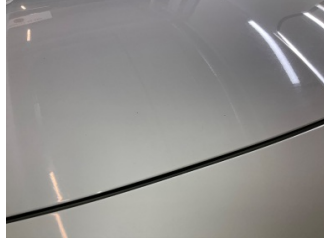
Motor kaputu, Motor kaputu > Taş Izı