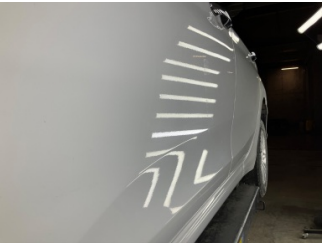
Kapı, sol ön, Kapı, sol ön > Vuruk