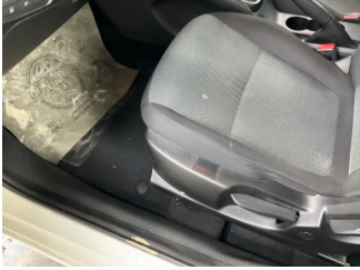
Taban, Paspaslar > Sökülmüş-Yok