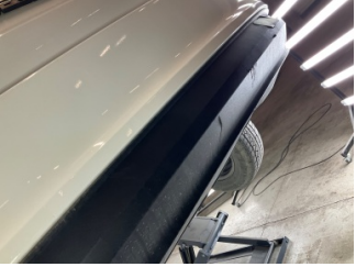
Tampon, arka, Spoiler > Çizik