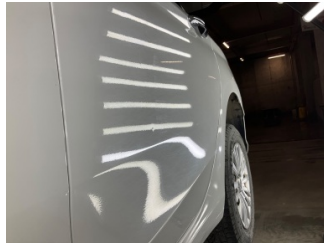
Kapı, sol arka, Kapı, sol arka > Vuruk