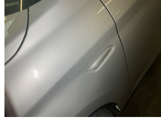
Çamurluk, sol, Çamurluk, sol > Küçük Çizik