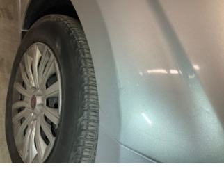
Çamurluk, sağ, Çamurluk, sağ > Standart Dışı Onarım

Sayfa: 10/11 Araç Çıkış Tarihi: 10.06.2026 09:36