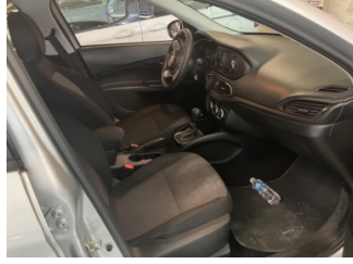
Döşemeler/Kapaklar, D-direk iç kaplaması, sol > Kirlenmiş