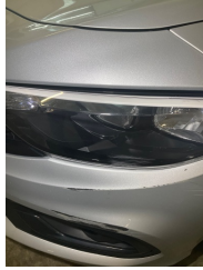
Farlar, Far camı, sol > Çizik