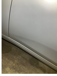
Kapı, sol ön, Kapı, sol ön > Vuruk