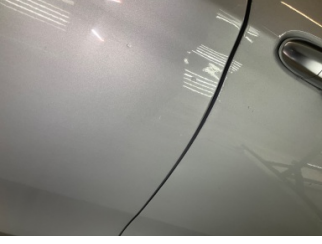
Kapı, sağ arka, Kapı, sağ arka > Vuruk