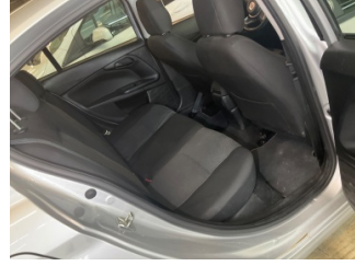
Döşemeler/Kapaklar, D-direk iç kaplaması, sol > Kirlenmiş