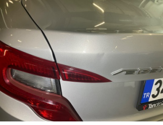
Bagaj kapağı/kapısı, Bagaj kapısı > Vuruk