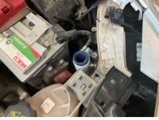
Cam yıkama/silme sistemi, Cam suyu bidonu kapağı > Sökülmüş-Yok