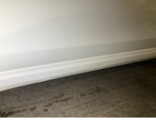
Marşbiyel, sol, Marşbiyel, sol > Vuruk