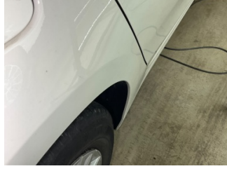
Çamurluk, sağ arka, Çamurluk, sağ arka > Vuruk