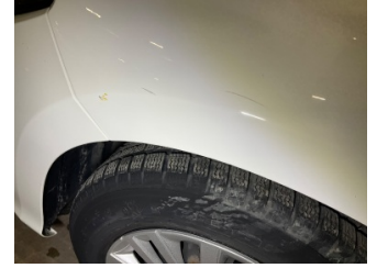
Çamurluk, sol, Çamurluk, sol > Küçük Çizik