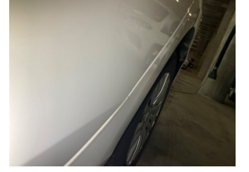
Çamurluk, sol arka, Çamurluk, sol arka > Vuruk