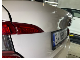
Bagaj kapağı/kapısı, Bagaj kapısı > Vuruk