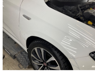
Çamurluk, sağ, Çamurluk, sağ > Hasarlı