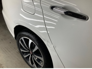
Çamurluk, sağ arka, Çamurluk, sağ arka > Hasarlı