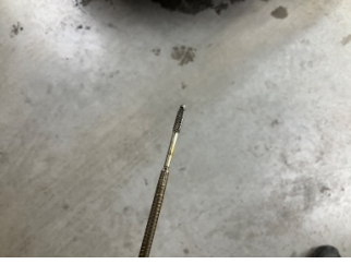
Motor, Yağ seviyesi > Eksik