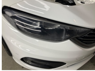
Farlar, Far camı, sağ > Islak- Nemli