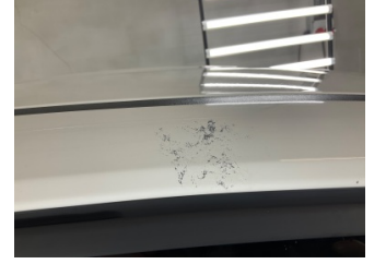
Kaporta, Sağ Üst Frangart > Yakıcı Madde İle Zarar Görmüş