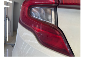
Arka lambalar, Arka lamba camı, sol > Hasarlı