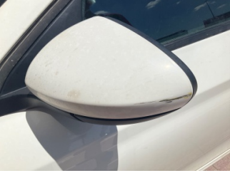
Dikiz aynası, sol, Dış dikiz aynası kapağı > Çizik