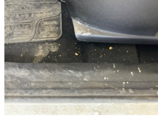
Taban, Taban halısı > Yakıcı Madde ile Zarar Görmüş