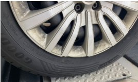
Jant kapağı, sol ön > Hasarlı