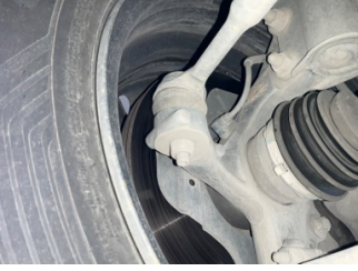
Direksiyon sistemi, Rot kolu/Rot başı, sol > Deforme Olmuş