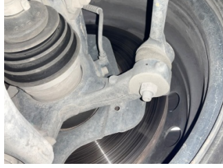
Direksiyon sistemi, Rot kolu/Rot başı, sağ > Deforme Olmuş