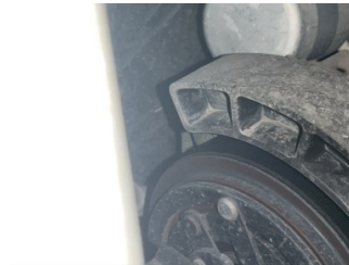
Motorsöğütması, Kayış > Deforme Olmuş