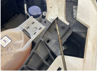
Motor, Yağ seviyesi > Eksik

Sayfa: 9/10 Araç Çıkış Tarihi: 22.06.2026 11:35