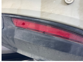
Tampon, arka, Reflektör, sağ > Hasarlı