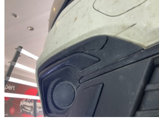
Sis lambaları, Sis Izgarası Sağ > Hasarlı