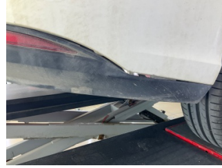
Tampon, arka, Spoiler > Hasarlı