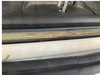
Arka bölüm, Arka sac/panel > Standart Dışı Onarım