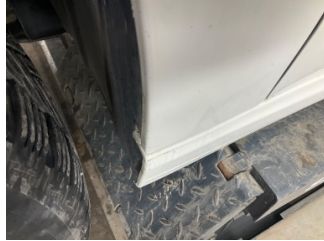
Marşbiyel, sol, Marşbiyel, sol > Çizik