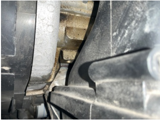
Motor, Külbütör kapağı > Yağ Kaçağı