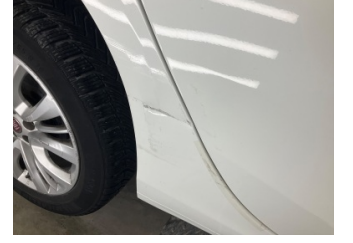
Çamurluk, sağ arka, Çamurluk, sağ arka > Hasarlı