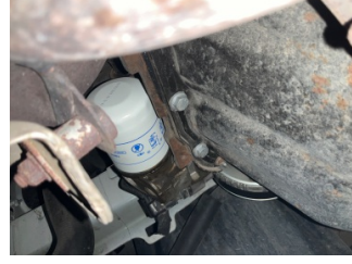
Motor, Yağ filtresi > Yağ Kaçağı