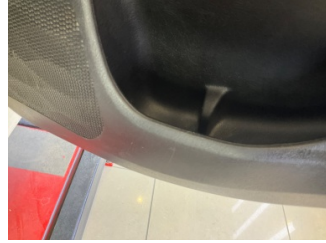
Döşemeler/Kapaklar, Döşemeler/Kapaklar > Çizik