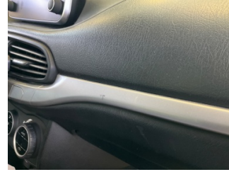
Döşemeler/Kapaklar, Döşemeler/Kapaklar > Çizik