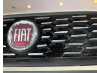
İlave parçalar, ön, Ön panjur > Hasarlı