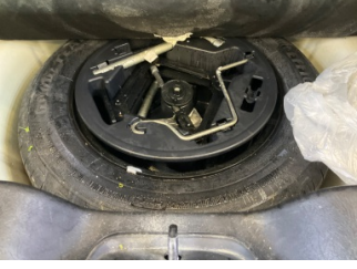
Arka bölüm, Bagaj havuzu > Islak-Nemli

Rapor Tarihi: 06.03.2026 11:11 Bayi No: 0601 Sayfa: 10/11 Rapor No: 06-01-1468872 Araç Giriş Tarihi: 06.03.2026 10:06 Araç Çıkış Tarihi: 06.03.2026 11:11 Mersis No: 0309073518100001