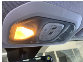
Elektrik donanımı/Pano, İç aydınlatma, ön > Ampülü Yanmıyor