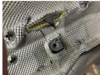
Motor, Motor üst kapağı, plastik > Eksik