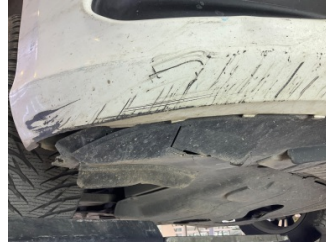
Tampon, ön, Tampon koruyucu sağ > Hasarlı