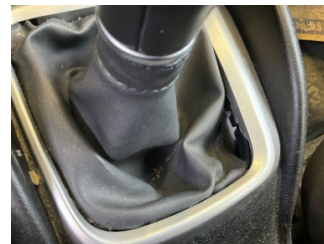
Şanzıman, Vites körüğü > Hasarlı