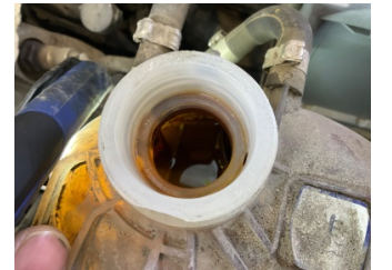
Motorsoğutması, Soğutma sıvısı > Kirlenmiş