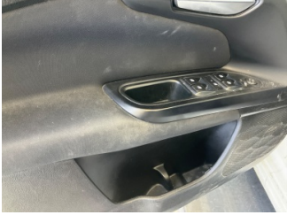
Döşemeler/Kapaklar, Döşemeler/Kapaklar > Çizik