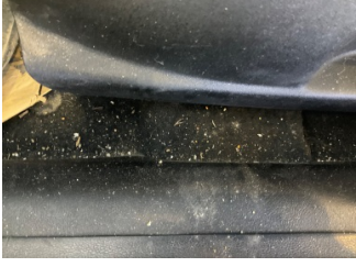
Taban, Taban halısı > Yakıcı Madde ile Zarar Görmüş

Sayfa: 9/11 Araç Çıkış Tarihi: 06.03.2026 11:11