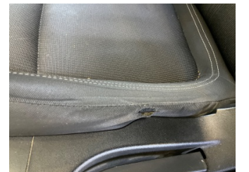
Koltuklar, ön, Koltuk, sol ön > Yıpranmış