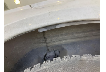
Çamurluk, sağ arka, Davlumbaz > Hasarlı