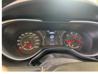
Motor, Motor > Uyarı Lambası Yanıyor