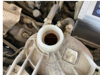
Motorsoğutması, Soğutma sıvısı > Eksik