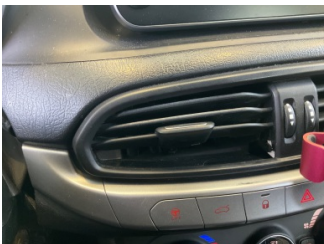
Kalorifer/Klima, Havalandırma ızgarası sabitlemesi > Hasarlı