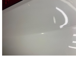
Tampon, arka, Arka tampon > Boyası Atmış