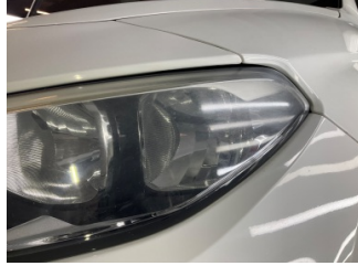
Farlar, Far camı, sol > Deforme Olmuş