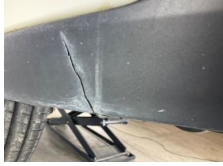
Tampon, arka, Spoiler > Kırılmış