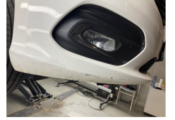
Tampon, ön, Ön tampon > Küçük Çizik