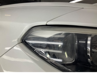
Farlar, Far camı, sağ > Deforme Olmuş