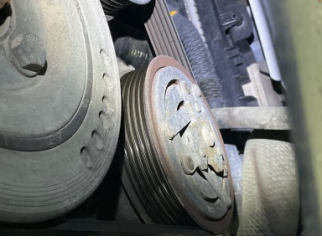
Motorsoğutması, Kayış > Çatlak