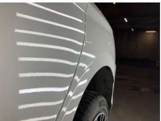
Çamurluk, sol arka, Çamurluk, sol arka > Vuruk