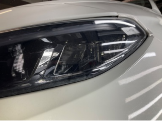
Farlar, Far camı, sol > Çizik