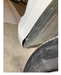
Çamurluk, sol, Davlumbaz > Sabitlemesi Hatalı