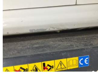
Marşbiyel, sol, Marşbiyel, sol > Boyası Atmış