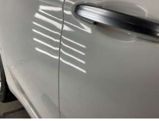
Kapı, sağ arka, Kapı, sağ arka > Vuruk