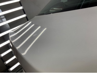
Bagaj kapağı/kapısı, Bagaj kapısı > Yakıcı Madde Ile Zarar Görmüş