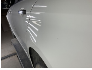
Çamurluk, sol arka, Çamurluk, sol arka > Vuruk