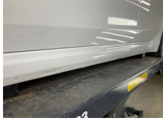
Marşbiyel, sol, Marşbiyel, sol > Boyası Atmış