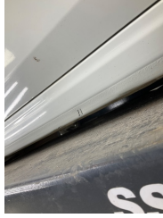
Marşbiyel, sağ, Marşbiyel, sağ > Vuruk