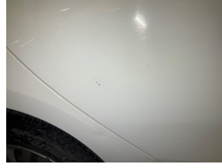
Kapı, sağ arka, Kapı, sağ arka > Vuruk