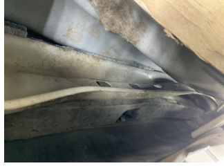
Kaporta, Kaporta > Hasarlı