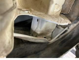
Kaporta, Kaporta > Hasarlı

Sayfa: 12/13 Araç Çıkış Tarihi: 16.06.2026 12:04