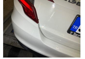
Bagaj kapağı/kapısı, Bagaj kapısı > Pas