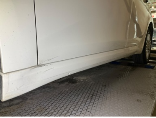
Marşbiyel, sol, Marşbiyel, sol > Hasarlı