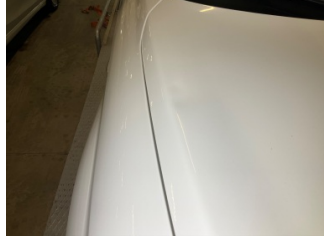
Motor kaputu, Motor kaputu > Vuruk