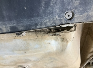
Arka bölüm, Bagaj havuzu > Ezik