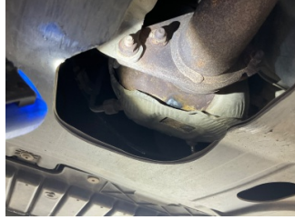
Egzoz sistemi, Partikül filtresi > Standart Dışı Onarım