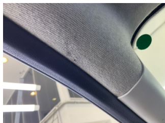
Döşemeler/Kapaklar, Tavan döşemesi > Yakıcı Madde İle Zarar Görmüş