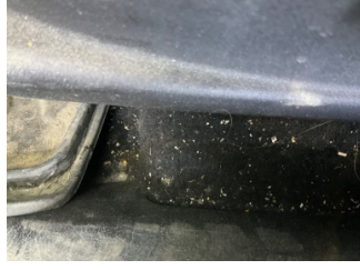
Taban, Taban halısı > Yakıcı Madde ile Zarar Görmüş