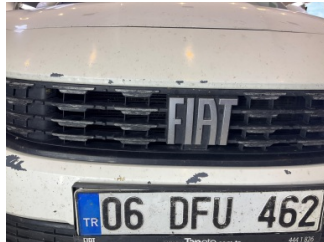
İlave parçalar, ön, Ön panjur > Deforme Olmuş