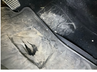
Taban, Taban halısı > Yakıcı Madde ile Zarar Görmüş

Sayfa: 9/10 Araç Çıkış Tarihi: 17.06.2026 14:40