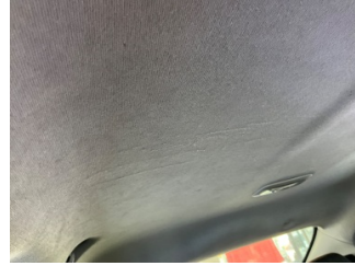
Döşemeler/Kapaklar, Tavan döşemesi > Çizik