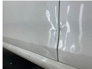
Kapı, sol arka, Kapı, sol arka > Hasarlı