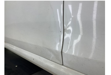
Kapı, sol ön, Kapı, sol ön > Hasarlı