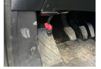
Elektrik donanımı/Pano, Kablo demeti > Sabitlemesi Hatalı