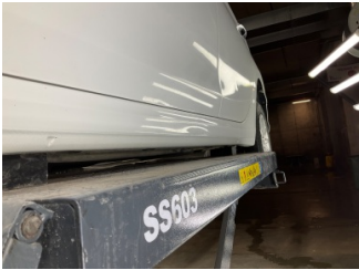
Marşbiyel, sol, Marşbiyel, sol > Vuruk