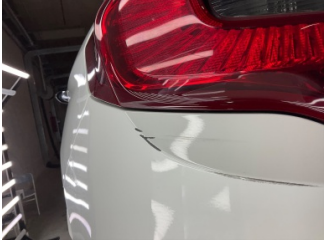
Arka lambalar, Arka lamba camı, sol > Çizik