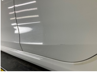
Kapı, sol arka, Kapı, sol arka > Noktasal Ezik