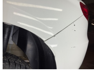
Tampon, arka, Spoiler > Sabitlemesi Hatalı