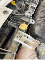
Motor kaputu, Dayama çubuğu/Amortisör > Kırılmış