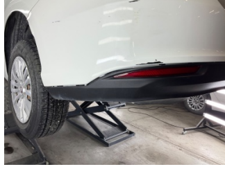
Tampon, arka, Spoiler > Sabitlemesi Hatalı