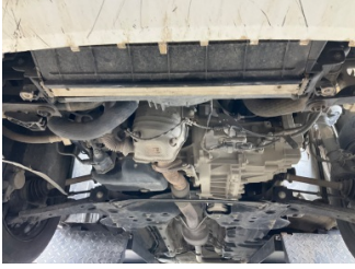
Motor, Alt muhafaza > Sökülmüş-Yok