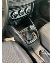
Şanzıman, Vites körüğü > Sabitlemesi Hatalı