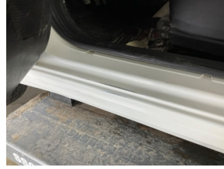
Marşbiyel, sol, Marşbiyel, sol > Boyası Atmış