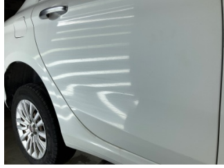
Kaporta, Kaporta > Yüzeysel Çizik