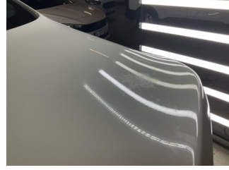
Bagaj kapağı/kapısı, Bagaj kapısı > Yakıcı Madde ile Zarar Görmüş