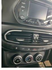
Kalorifer/Klima, Havalandırma izgarası sabitlemesi > Sabitlemesi Hatalı