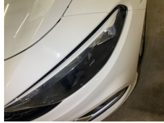
Farlar, Far camı, sol > Çizik