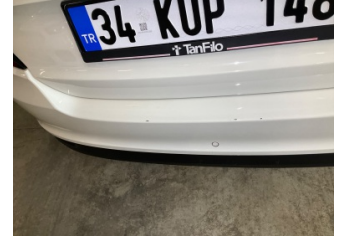
Tampon, arka, Arka tampon > Küçük Çizik