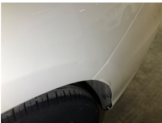
Çamurluk, sol arka, Çamurluk, sol arka > Vuruk