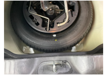
Arka bölüm, Bagaj havuzu > Islak-Nemli