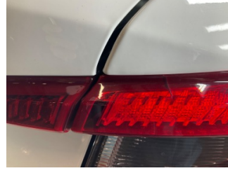
Arka lambalar, Arka lamba camı, sağ > Hasarlı