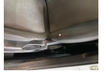
Döşemeler/Kapaklar, Döşemeler/Kapaklar > Hasarlı