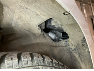
Çamurluk, sağ, Davlumbaz > Onaysız