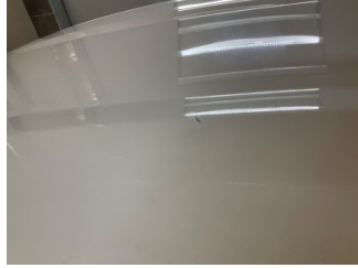
Tavan, Tavan > Çizik