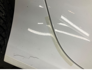
Marşbiyel, sağ, Marşbiyel, sağ > Çizik