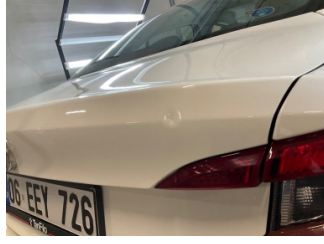
Bagaj kapağı/kapısı, Bagaj kapısı > Küçük Vuruk