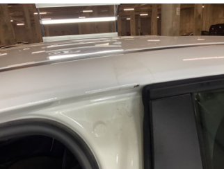
Kaporta, Sol Üst Frangart > Ezik