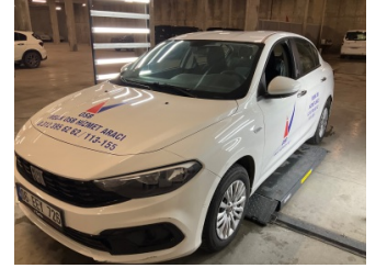
Kaporta, Kaporta > Etiket Yapıştırılmış