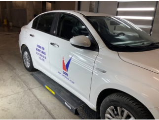
Kaporta, Kaporta > Etiket Yapıştırılmış