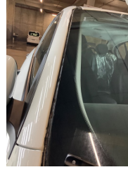
Camlar, Ön cam fitili > Onaysız