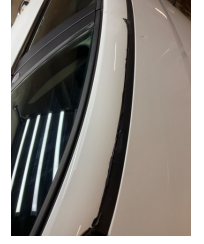
Camlar, Ön cam fitili > Onaysız