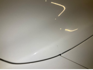
Motor kaputu, Motor kaputu > Taş izi