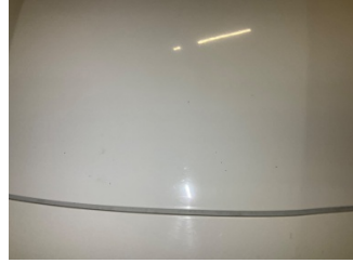
Motor kaputu, Motor kaputu > Taş izi