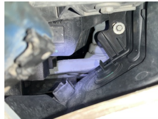
Tampon, ön, Bağlantı ayağı > Hasarlı