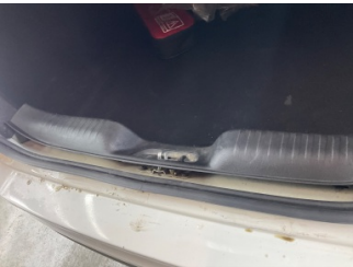
Döşemeler/Kapaklar, Yükleme eşiği kaplaması > Sabitlemesi Hatalı