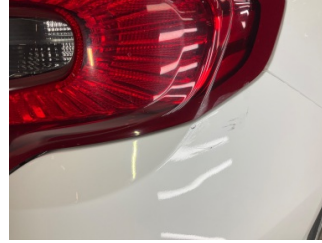
Arka lambalar, Arka lamba camı, sağ > Çizik