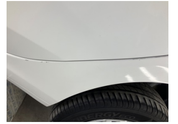
Çamurluk, sol arka, Çamurluk, sol arka > Boyası Atmış