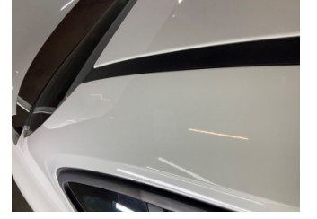
Kaporta, Sağ Üst Frangart > Ezik