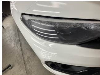
Farlar, Far camı, sağ > Islak-Nemli