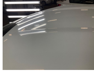
Tavan, Tavan > Dolu Hasarı