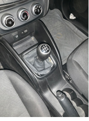
Şanzıman, Vites körüğü > Sabitlemesi Hatalı