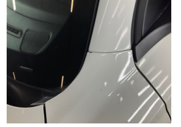
Çamurluk, sol, Çamurluk, sol > Ayarsız