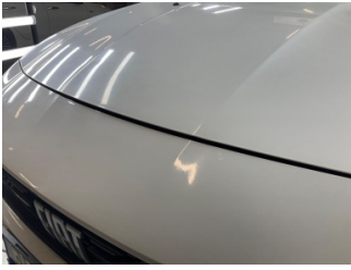
Motor kaputu, Motor kaputu > Ayarsız