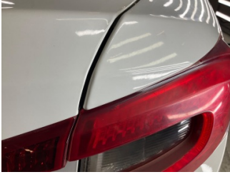
Arka lambalar, Arka lamba camı, sağ > Hasarlı