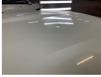
Tavan, Tavan > Yakıcı Madde ile Zarar Görmüş