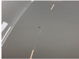
Motor kaputu, Motor kaputu > Yakıcı Madde İle Zarar Görmüş