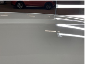
Tavan, Tavan > Yakıcı Madde İle Zarar Görmüş