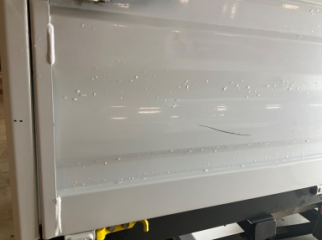
Kaporta, Kaporta > Çizik