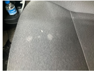
Döşemeler/Kapaklar, Döşemeler/Kapaklar > Yakıcı Madde ile Zarar Görmüş