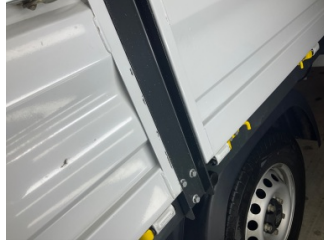
Kaporta, Kaporta > Çizik