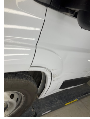
Kapı, sol ön, Kapı, sol ön > Hasarlı