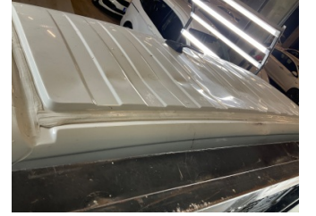
Tavan, Tavan > Hasarlı