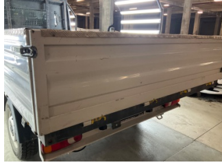
Kaporta, Kaporta > Ezik