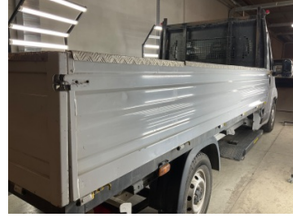
Kaporta, Kaporta > Ezik