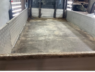
Kaporta, Kaporta > Standart Dışı Onarım