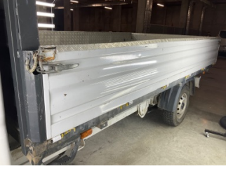
Kaporta, Kaporta > Ezik