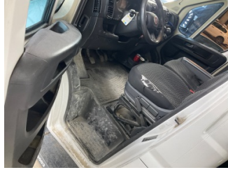
Döşemeler/Kapaklar, Döşemeler/Kapaklar > Çizik