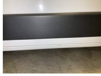
Marşbiyel, sağ, Marşbiyel, sağ > Vuruk