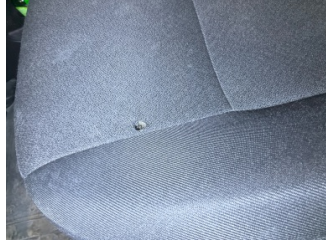
Döşemeler/Kapaklar, Döşemeler/Kapaklar > Yakıcı Madde Ile Zarar Görmüş