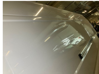
Çamurluk, sağ arka, Çamurluk, sağ arka > Hasarlı