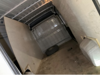
Döşemeler/Kapaklar, Döşemeler/Kapaklar > Sabitlemesi Hatalı