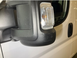
Dikiz aynası, sol, Dış dikiz aynası kapağı > Çizik