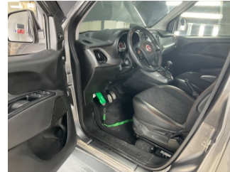
Döşemeler/Kapaklar, Döşemeler/Kapaklar > Çizik