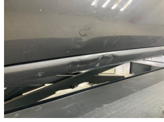
Marşbiyel, sol, Marşbiyel, sol > Ezik