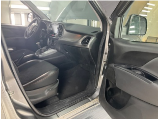
Döşemeler/Kapaklar, Döşemeler/Kapaklar > Çizik