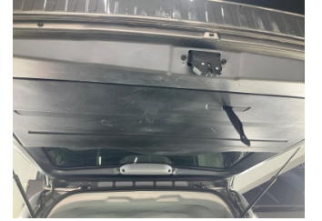
Döşemeler/Kapaklar, Bagaj kapağı, iç döşemesi > Çizik