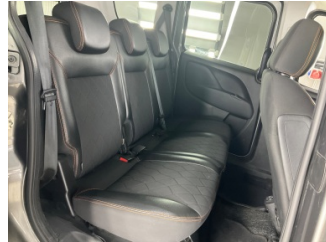
Döşemeler/Kapaklar, Döşemeler/Kapaklar > Çizik