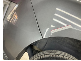
Çamurluk, sağ arka, Çamurluk, sağ arka > Standart Dışı Onarım