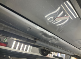
Kapı, sol ön, Kapı, sol ön > Ezik