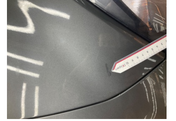
Çamurluk, sağ, Çamurluk, sağ > Rötüş