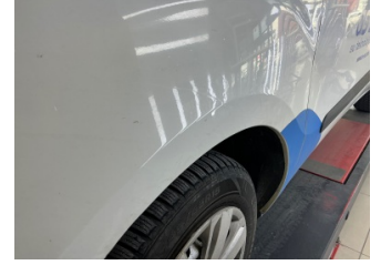
Çamurluk, sol, Çamurluk, sol > Standart Dışı Onarım