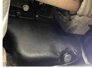
Motor, Motor > Yağ Kaçağı