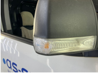
Dikiz aynası, sağ, Sinyal lambası > Islak-Nemli