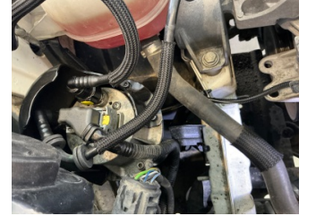
Motor, Motor/Yakıt sistemi > Sızdırıyor