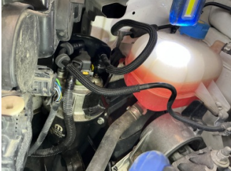
Motor, Motor/Yakıt sistemi > Sızdırıyor