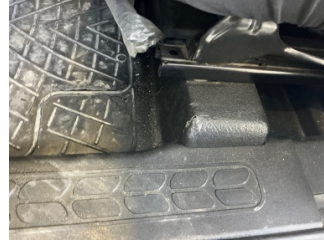
Döşemeler/Kapaklar, Tavan döşemesi > Hasarlı