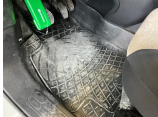
Taban, Paspaslar > Hasarlı