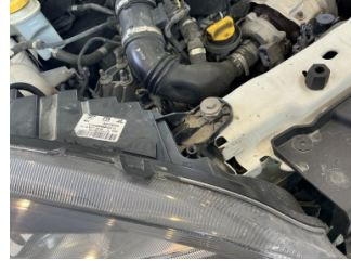
Farlar, Far bağlantı ayağı, sağ > Standart Dışı Onarım