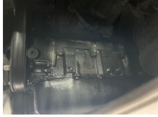
Motor, Motor > Yağ Kaçağı