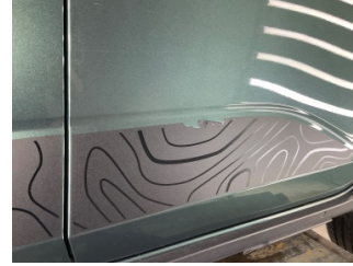
Kapı, sol arka, Kapı bandı > Onaysız