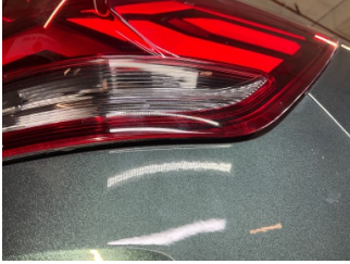
Arka lambalar, Arka lamba camı, sağ > Çatlak