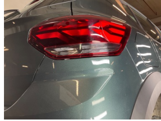
Arka lambalar, Arka lambalar, sağ > Sabitlemesi Hatalı