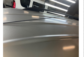
Kaporta, Kaporta > Dolu Hasarı