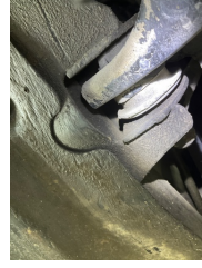
Ön aks, Salıncak, ön sağ üst > Hasarlı