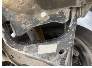
Ön aks, Salıncak, ön sol üst > Hasarlı