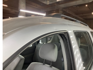
Kaporta, Kaporta > Dolu Hasarı