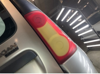
Arka lambalar, Arka lamba camı, sağ > Deforme Olmuş