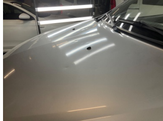
Kaporta, Kaporta > Dolu Hasarı