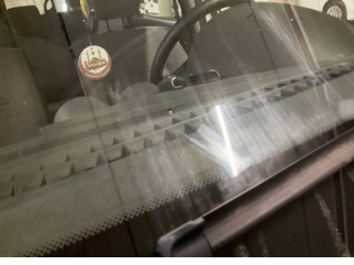
Camlar, Ön cam > Çatlak