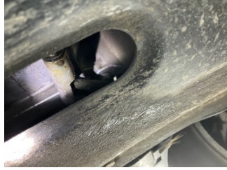
Motor, Marş motoru > Yağ Kaçağı