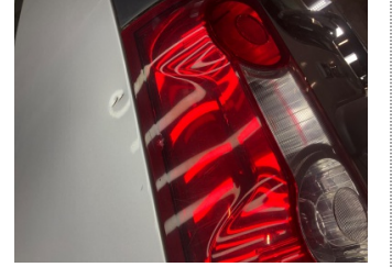
Arka lambalar, Arka lamba camı, sol > Çatlak