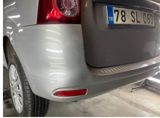
Bagaj kapağı/kapısı, Bagaj kapısı > Boyası Atmış