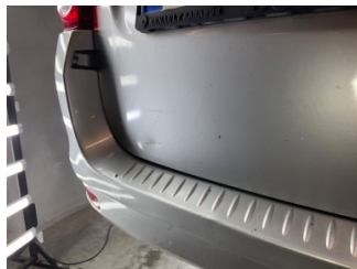
Bagaj kapağı/kapısı, Bagaj kapısı > Vuruk