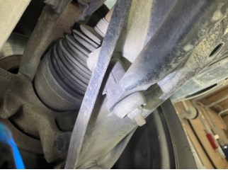
Ön aks, Denge çubuğu, ön > Hasarlı