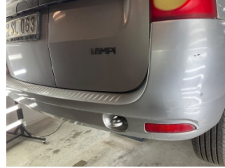
Bagaj kapağı/kapısı, Bagaj kapısı > Boyası Atmış