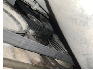
Motorsoğutması, Kayış > Çatlak