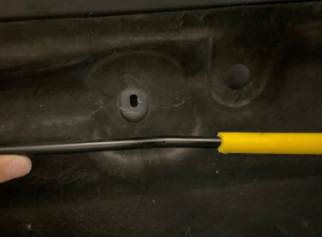
Motor kaputu, Dayama çubuğu/Amortisör > Onaysız