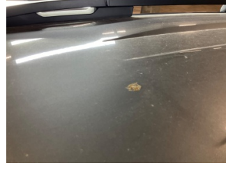
Tavan, Tavan > Yakıcı Madde İle Zarar Görmüş