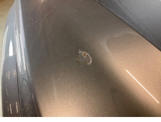
Motor kaputu, Motor kaputu > Yakıcı Madde İle Zarar Görmüş