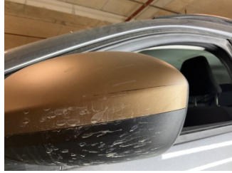
Dikiz aynası, sol, Dış dikiz aynası cerçevesi > Çizik