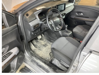
Döşemeler/Kapaklar, Döşemeler/Kapaklar > Kirlenmiş