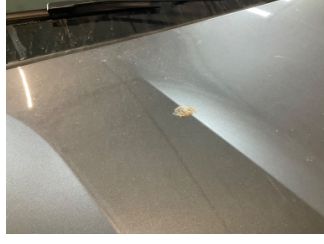
Motor kaputu, Motor kaputu > Yakıcı Madde İle Zarar Görmüş