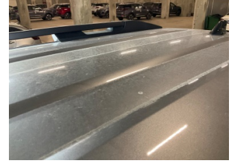
Tavan, Tavan > Yakıcı Madde İle Zarar Görmüş