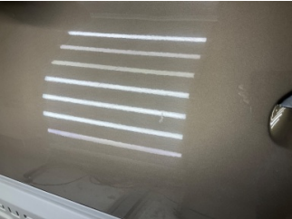
Kapı, sol ön, Kapı, sol > Çizik