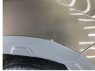
Çamurluk, sol arka, Nikelaj > Çizik