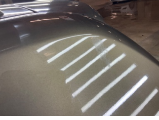
Çamurluk, sol arka, Çamurluk, sol arka > Yakıcı Madde Ile Zarar Görmüş

Sayfa: 9/11 Araç Çıkış Tarihi: 23.05.2026 09:10