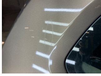
Çamurluk, sağ arka, Çamurluk, sağ arka > Yakıcı Madde Ile Zarar Görmüş