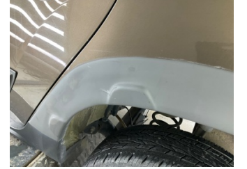
Çamurluk, sol arka, Nikelaj > Çizik