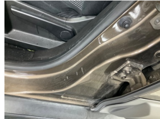
Kaporta, B-direk, sol > Çizik