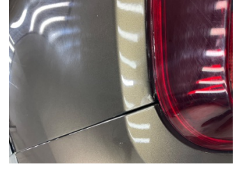
Çamurluk, sol arka, Çamurluk, sol arka > Standart Dışı Onarım