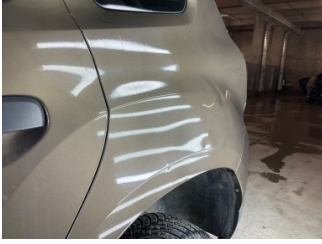
Çamurluk, sol arka, Çamurluk, sol arka > Hasarlı