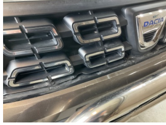
İlave parçalar, ön, Ön panjur > Standart Dışı Onarım