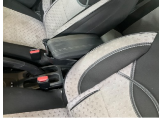
Döşemeler/Kapaklar, Kol dayaması, ön > Hasarlı