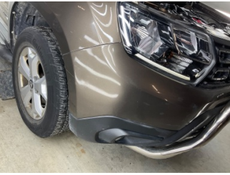
Tampon, ön, Ön tampon > Ezik