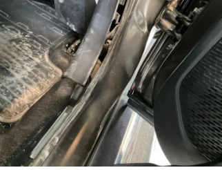
Kaporta, B-direk, sağ > Ezik