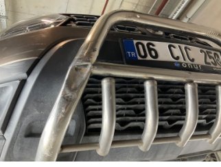
Tampon, ön, Spoyler > Ezik