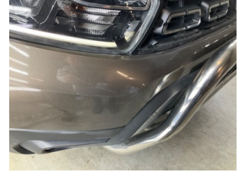
Tampon, ön, Ön tampon > Ezik