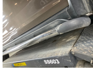
Marşbiyel, sağ, Marşbiyel plastiği, sağ > Ezik