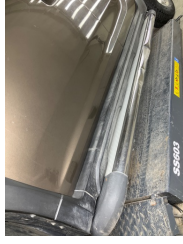
Marşbiyel, sol, Marşbiyel plastiği, sol > Ezik