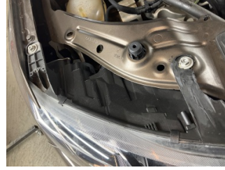
Farlar, Far bağlantı ayağı, sağ > Standart Dışı Onarım